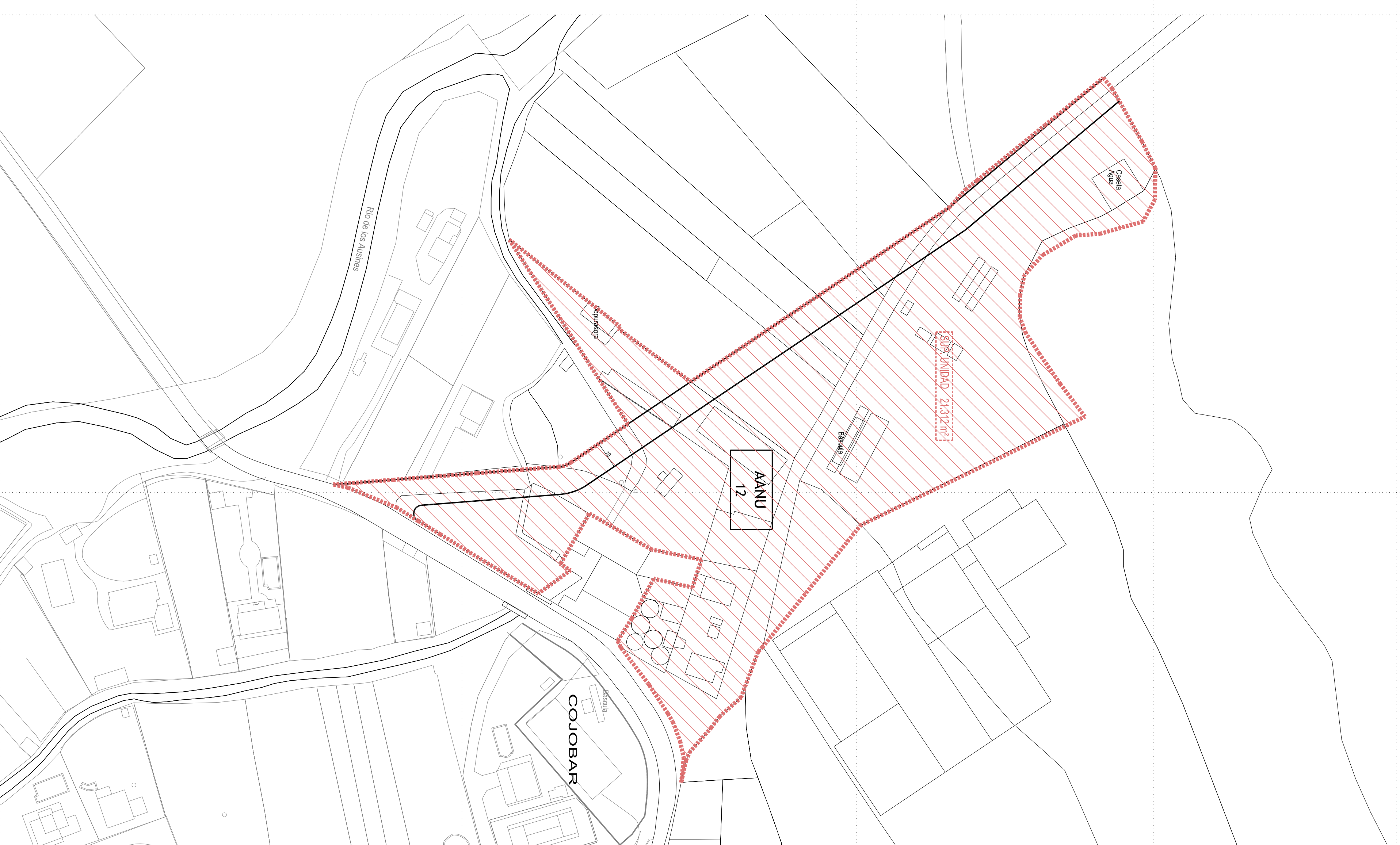
EMPLAZAMIENTO E: 1:1000

UNIDAD DE NORMALIZACION AANU-12 COJOBAR MODULAR DE LA EMPAREJADA BURGOS